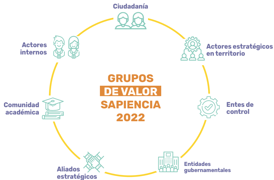
Gráfico 2 Grupos de Valor Sapiencia 2022